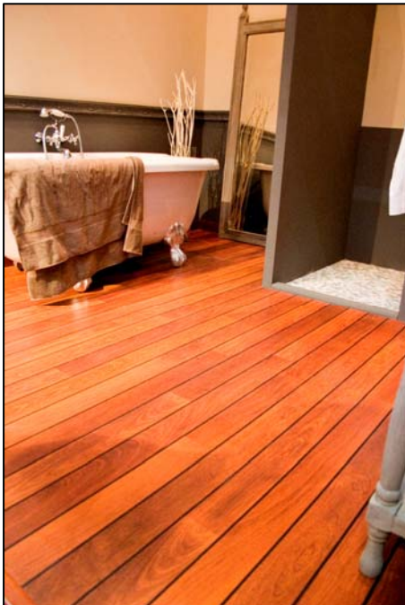
UR 1032 Merbau

Dans cette gamme, Quick-Step lance une finition teck gris et merbau rouge-brun vernie en petites lames étroites de 138 cm de long sur 10 cm de large. Les raccords en caoutchouc sur le côté long et le joint placé manuellement (sealing) sur le côté court en font une solution adaptée aux pièces humides.